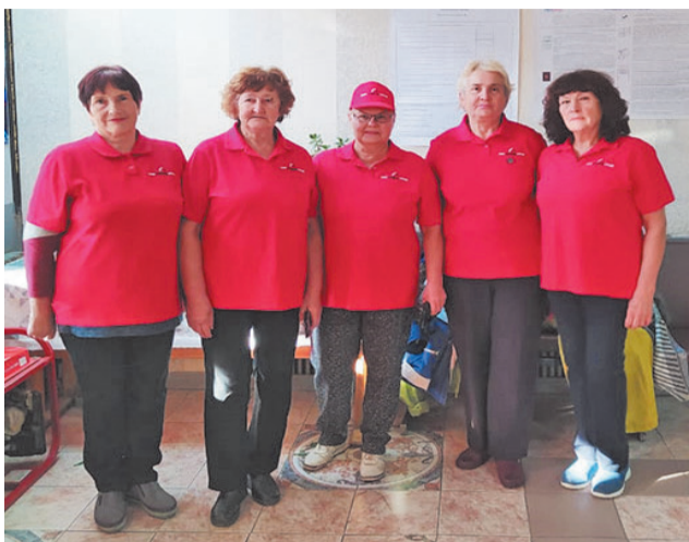
Команда ТОС "Тоннельщики" прибыла на избирательный участок на выборы главы Республики Бурятия 11 сентября в 7:45